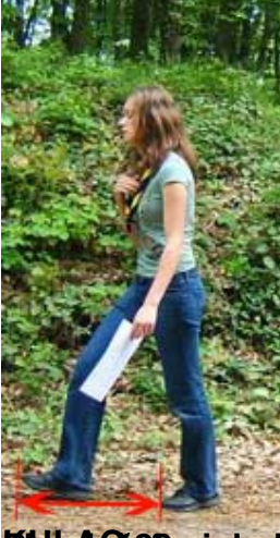
Kıllı kıyım ve saç (örneğin 10 cm) ya da saçlar düzlenmiş durumda ölçülür. İş mesleklerinde