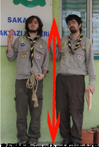
Kıllı kıyım ve saç (örneğin 10 cm) ya da saçlar düzlenmiş durumda ölçülür. İş mesleklerinde